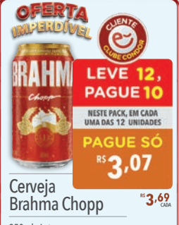
Cerveja Brahma Chopp