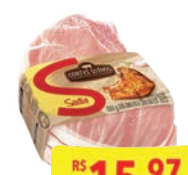
Bisteca Suína Sadia