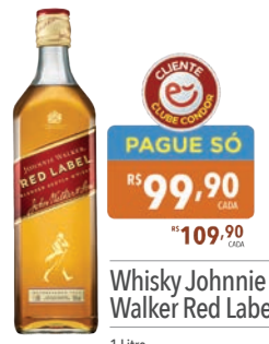
Whisky Johnnie Walker Red Label

Para aproveitar esta promoção, informe seu CPF no caixa e resgate sua oferta.