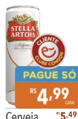
Cerveja Stella Artois