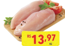
Filé de Peito de Frango