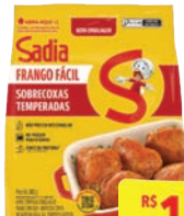
Sobrecoxa Frango Fácil Sadia