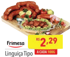
Linguiça Tipo Calabresa Frimesa