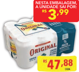
Cerveja Antarctica Original