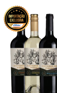
Vinho Chileno Catador de Piedra