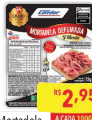
Mortadela Ouro Perdigão