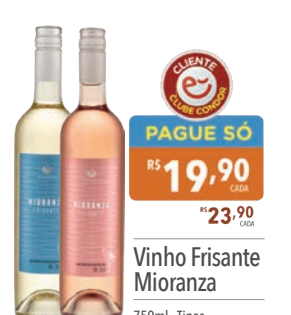
Vinho Frisante Mioranza