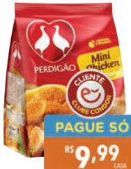
Mini Chicken Perdigão