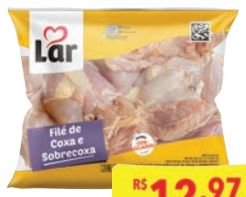
Filé de Coxa e Sobrecoxa Lar