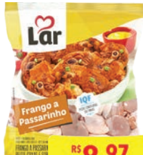
Frango a Passarinho Lar