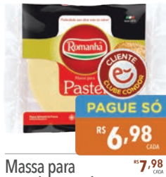
Massa para Pastel Romanha