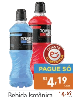
Bebida Isotônica Powerade