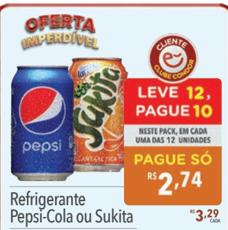
Refrigerante Pepsi-Cola ou Sukita