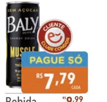
Bebida Energética Baly