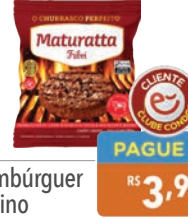
Hambúrguer Bovino Maturatta