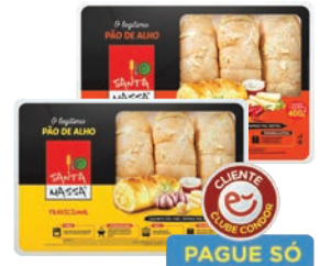
Pão de Alho Santa Massa