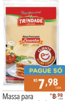
Massa para Lasanha Trindade